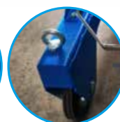
Kranösen am Gestell und Sammelbehälter